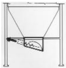
TIP.34 – Csatlakozó alj csigás kihordáshoz 30°-os hajlásszögben