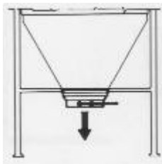
TIP.32 – Kézi súber horganyzott acélkerettel, görgőkkel